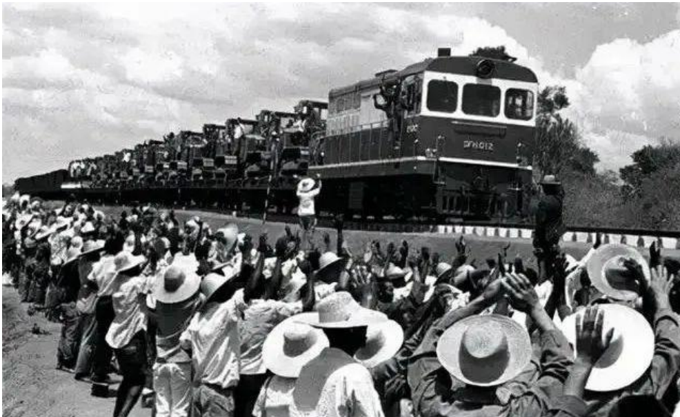
Le soutien de la Chine à la construction du TAZARA dans les années 1970 fut une incarnation du « discours sur la fraternité » entre la Chine et l'Afrique.

imaginaire anticolonial peut ne pas correspondre à la réalité. En mot, nous ne pouvons pas abandonner le rôle fondamental joué par nos « frères africains » dans la diplomatie chinoise, mais nous devons en pratique traiter l'Afrique comme un « partenaire stratégique pour le développement ».